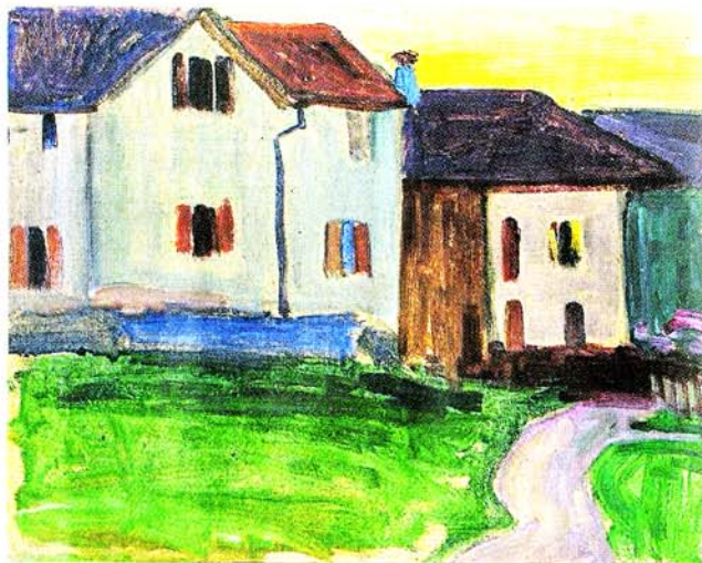
„Häuser in Murnau“, Gabriele Münters Gemälde aus dem Jahr 1908, hängt in der Galerie Thomas.

Durch diese fast schrille Verfremdung wird nicht nur die plastisch-bewegte Wirkung des barocken Sakralraumes betont. Man könnte vielmehr sogar meinen, unsere Farbwahrnehmung sei plötzlich in den ultravioletten und infraroten Bereich hinein erweitert. Das ist natürlich eine Illusion, aber gerade dadurch eine kongeniale Anverwandlung und moderne